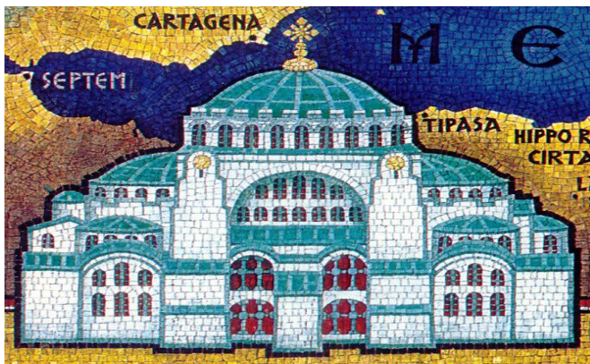
Мозаик во црквата „Сан Витал“ во Равена на кој е претставена црквата „Света Софија“, која се наоѓа во Цариград, а е изградена во време на владеењето на Јустинијан I.