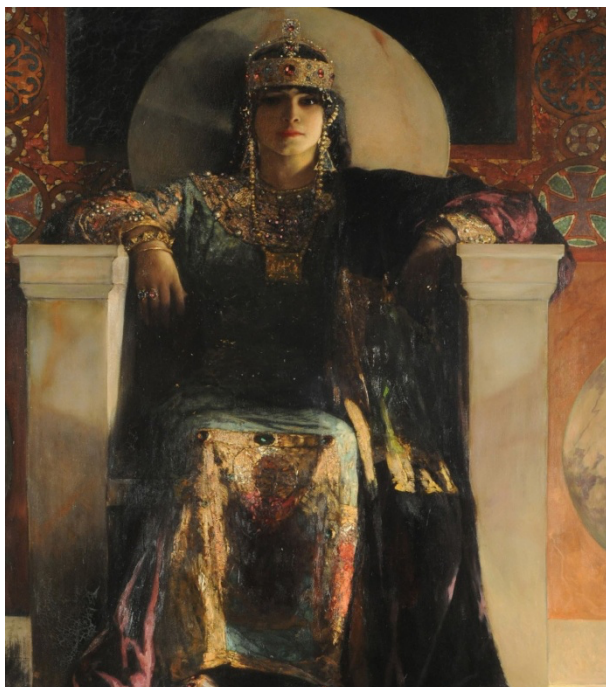
Жан-Жозеф Бенжамен-Констант, Царица Теодора, 1887 (масло на платно).