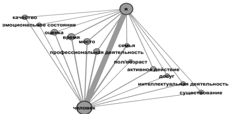
Рис. 1. Модель семантической структуры текстов информантов в возрасте 25–34-х лет